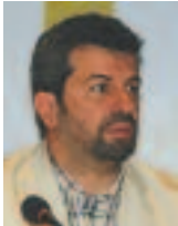
Γράφει ο Λάμπρος Μπίζας

Η Ένωση Νοσηλευτών Ελλάδος (Ε.Ν.Ε.) στα πλαίσια των δραστηριοτήτων της που πηγάζουν πρωτίτως από τους ίδιους τους σκοπούς της, όπως αυτοί περιγράφονται στις διατάξεις του άρθρου 2 του Νόμου 3252/2004 και ειδικότερα αναφορικά με την επιστημονική προαγωγή των μελών της, την προαγωγή και ανάπτυξη της Νοσηλευτικής ως ανεξάρτητης και αυτόνομης Επιστήμης και Τέχνης με σκοπό την συμβολή στην προστασία της υγείας του Ελληνικού Λαού, αποφάσισε την δημιουργία των Νοσηλευτικών Επιστημονικών Τομέων (NET) της Ε.Ν.Ε..