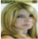
Γράφει η Ιωάννα Αχιλλεοπούλου

Α ραγε πόσοι από μας ψάχνουμε δουλειά; Πόσοι συνάδελφοι αντιμετωπίζουν αντίξοες συνθήκες εργασίας, εξαιτίας της έλλειψης προσωπικού και του βεβαρημένου φόρτου εργασίας; Τελικά η ανεργία επηρεάζει μόνο τους ανέργους ή ολόκληρο το νοσηλευτικό κλάδο;