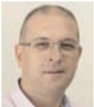
Αριστείδης Δάγλας, Γενικός Γραμματέας Ε.Ν.Ε.