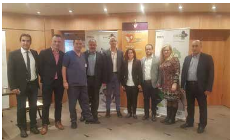
Φωτογραφικό υλικό από την ενημερωτική ημερίδα του Προγράμματος στο Ιατρικό Διαβαλκανικό Κέντρο στη Θεσσαλονίκη, στις 12 Νοεμβρίου 2019